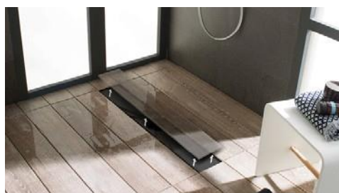
Showerdeck de Butech Showerdeck by Butech