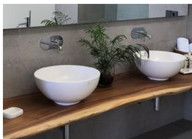
Encimera de madera tropical y lavabos redondos modelo Lounge Tropical Wood sink counter with round wash basin, Type Lounge