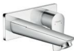
Grifería empotrada Hansgrohe Built-in tap. Hansgrohe