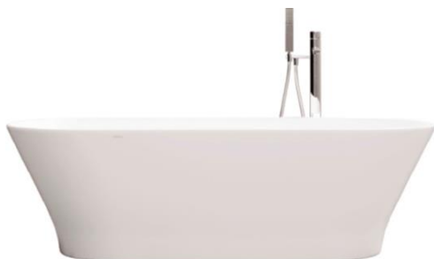
Bañera independiente Krion Freestanding bathtub by Krion