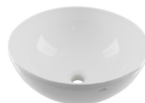
Lavabo redondo blanco modelo LOUNGE de PORCELANOSA Round wash basin type LOUNGE by PORCELANOSA .